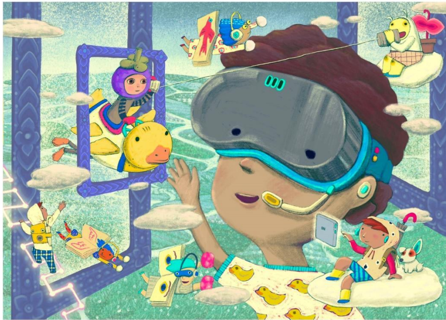
由 Kampanart Sangsorn 绘制的《亚洲少儿读物节 2021》关键视觉

新加坡，2021 年 4 月 23 日 – 经过一年的干扰和社交距离后，第十二届亚洲少儿读物节（AFCC）将于 2021 年 5 月 27 日至 30 日以全新的混合形式进行。一年一度的少儿读物节将推出在线和面对面活动结合的混合形式，其中包括 50 多名本地和国际演讲者。门票现已发售，团购可在早鸟促销期间，即至 4 月 30 日为止，享有高达 25% 的折扣。